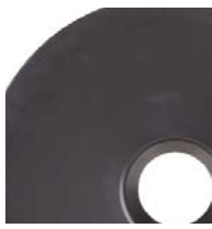
200 l (55 gal)