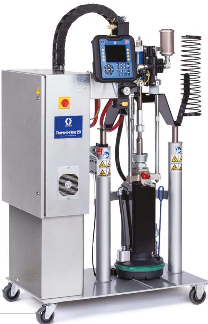
Therm-O-Flow 20 (5 gal)