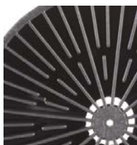
200 l (55 gal)