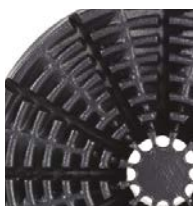
20 l (5 gal)