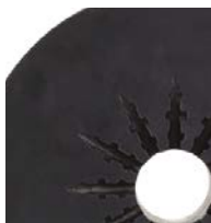
20 l (5 gal)